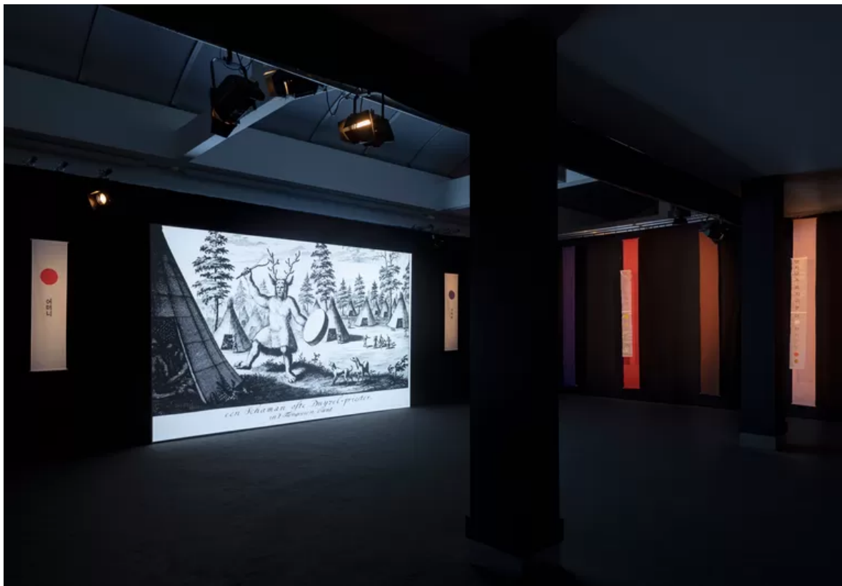
Video-installatie 'Four Months, Four Million Light Years'.

“Al redden we er maar één!” Schrijver Jan den Hartog (1914-2002)