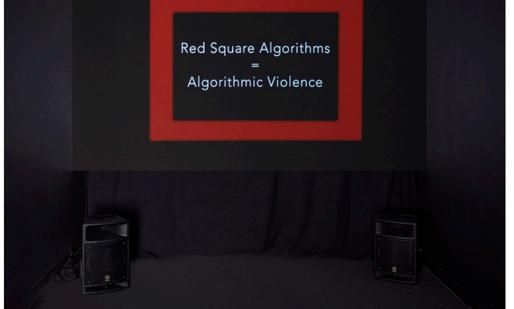
Lynn Hershman Leeson, 'Staged Intimacy 1974-2019' bij a rose is a rose is a rose (Rozenstraat)