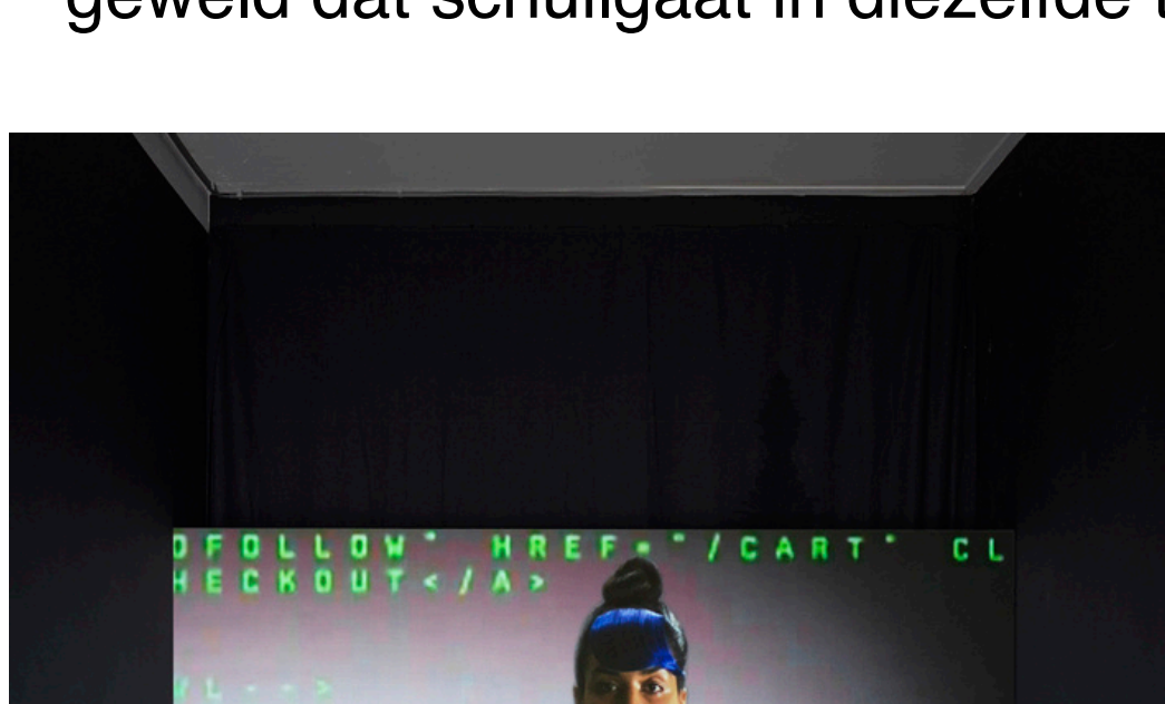
Lynn Hershman Leeson, 'Staged Intimacy 1974-2019' bij a rose is a rose is a rose (Rozenstraat)

Waar Leeson in eerder werk nog verkondigt dat digitale zelfdocumentatie 'haar leven heeft gered,' onderstreept ze in haar latere werken het mogelijke geweld dat schuilgaat in dezezelfde technologie