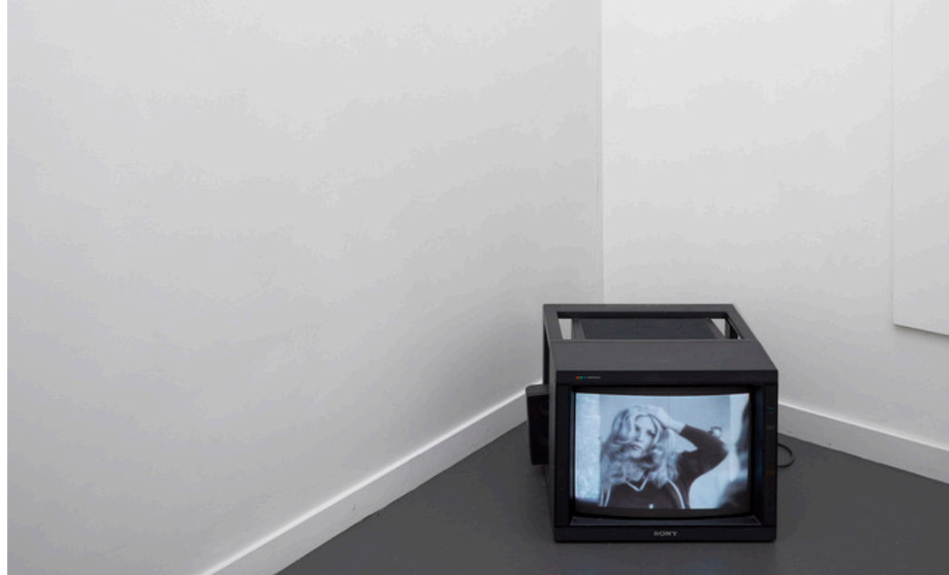
Lynn Hershman Leeson, 'Staged Intimacy 1974-2019' bij a rose is a rose is a rose (Rozenstraat)