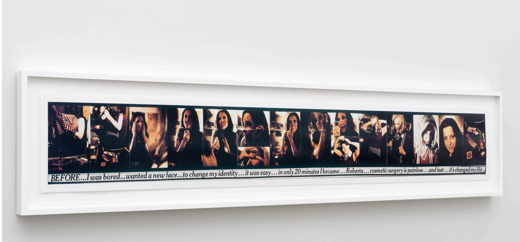
Lynn Hershman Leeson, 'Staged Intimacy 1974-2019' bij a rose is a rose is a rose (Rozenstraat)

Bij hedendaagse kijkers roept de Breitmore-reeks wellicht associaties op met Excellences & Perfections (2015), het beruchte online performancewerk van de Argentijnse kunstenaar Amalia Ulman. Voor dit project experimenteerde Ulman, in soortgelijke stijl als die van Leeson, met fictieve zelfportretten op social media, waarbij de hoofdpersoon het selfie-gerichte gedrag van welvarende influencers simuleerde. Foto's van latte art , Instagram-poëzie en andere stereotype 'millennial' bezigheden passeerden de revue. Echter, waar het werk van Ulman als een performatieve kritiek op online zelfpresentatie diende, is de ironische bijklink van de Breitmore-reeks beduidend zachter. Leeson lijkt haar personage in te zetten als een oprechte poging tot catharsis, een vehikel voor zowel triomfantelijk escapisme (zo bemachtigde Leeson op naam van Breitmore een creditcard die ze op haar eigen naam niet krijgen kon) als gedegen zelfanalyse: net als haar bedenker, die haar gehele jeugd ernstig mishandeld werd, blijkt Breitmore een scala aan pijnlijke herinneringen te hebben.